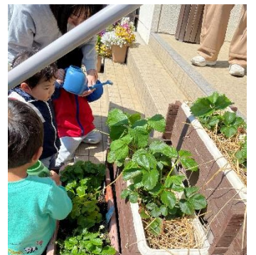
わんぱくルーム玄関前で 育てているいちごにお水をあげてくれています。