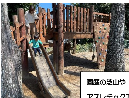
園庭の芝山や アスレチックであそぶすすくさん。